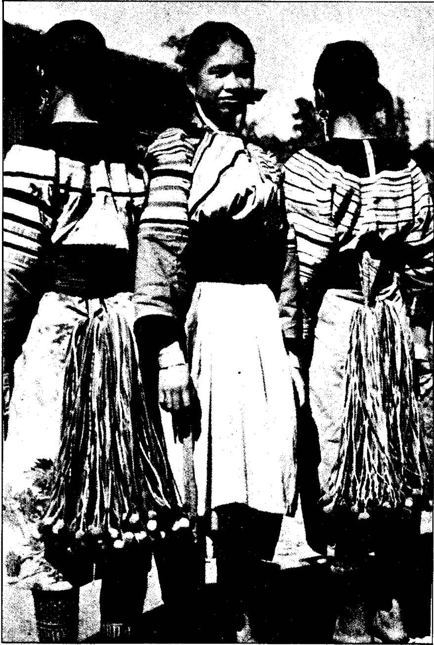
หญิงสาวลือข