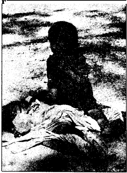
เด็กหญิงลีซอเตียงนอน เมื่อพ่อแม่ไปทำไร่