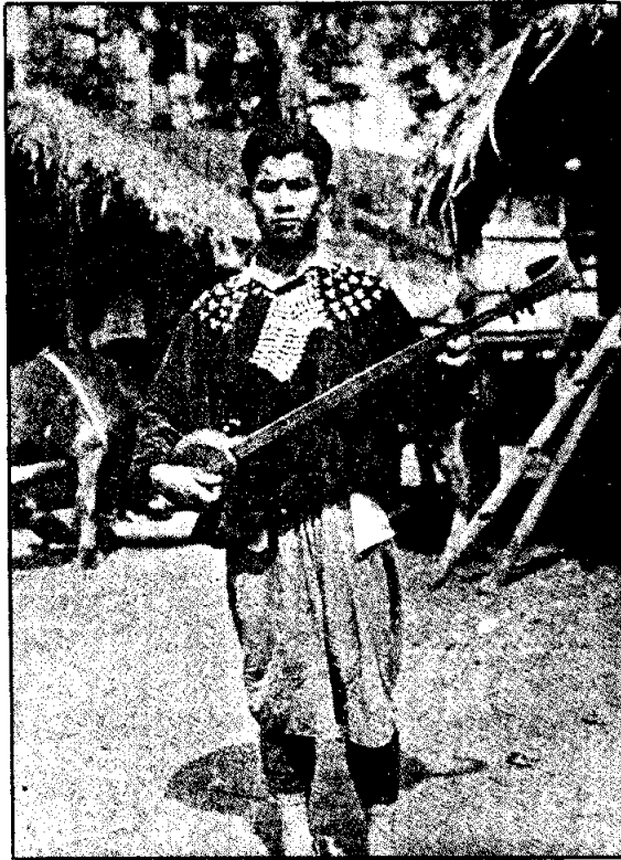
หม่อมลือ กับชอโบ