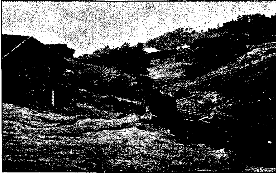
ลักษณะหมู่บ้านชาวลีซอ