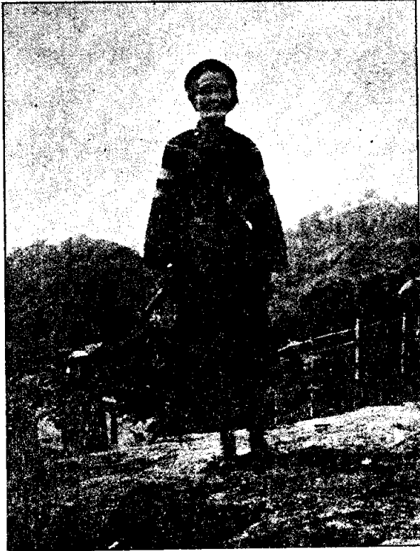
ผู้เขายืมคอนรับแขกที่มาเยี่ยมเยือนหมู่บ้าน