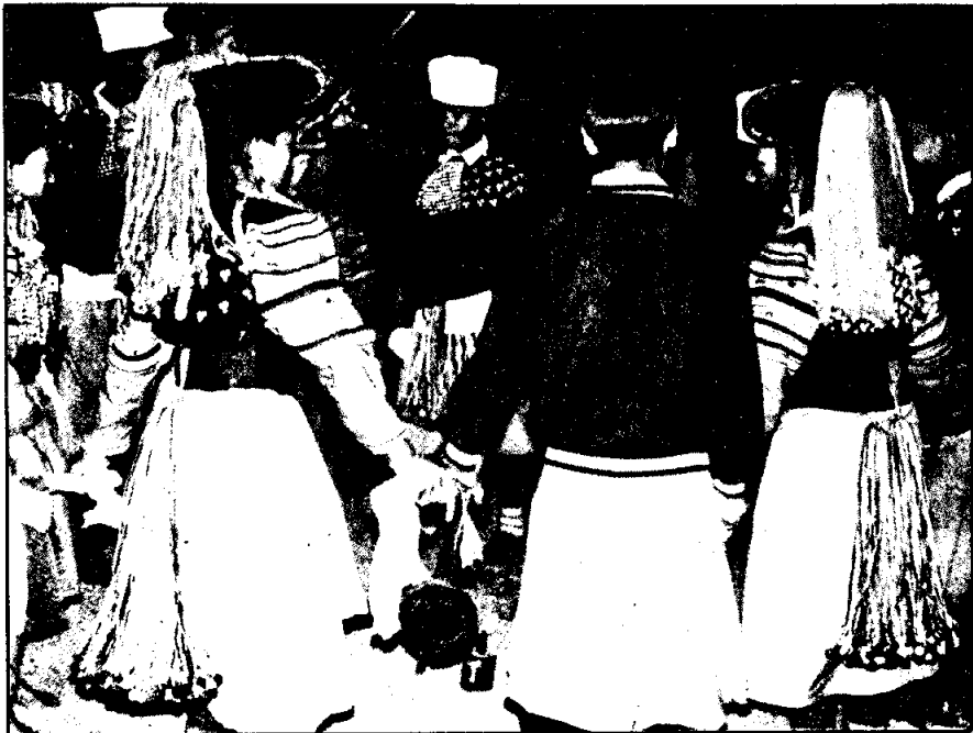
การเต้นรำในงานฉลองปีใหม่