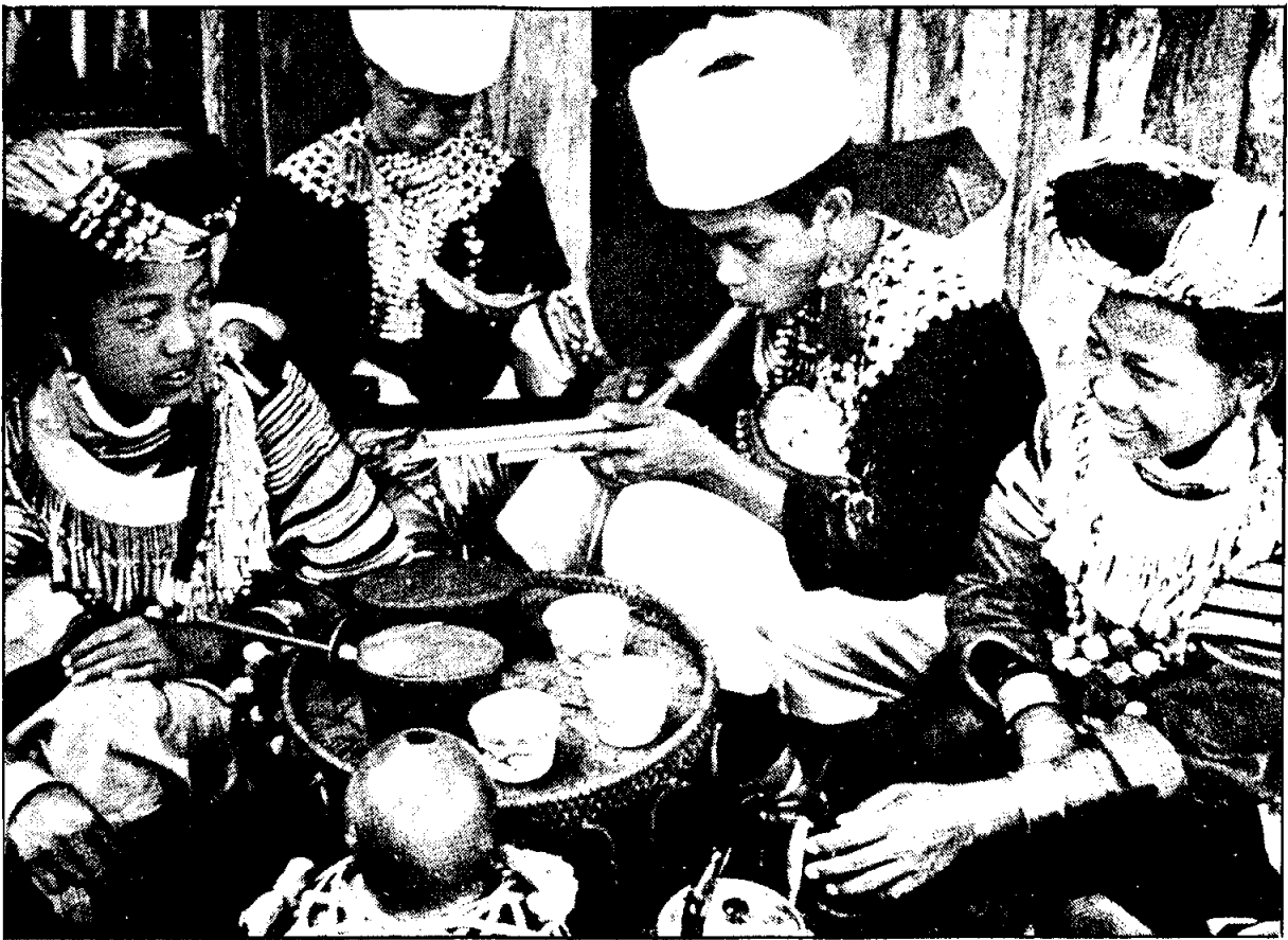
การแต่งกายของชายหนุ่มและหญิงสาวในเทศกาลสำคัญ