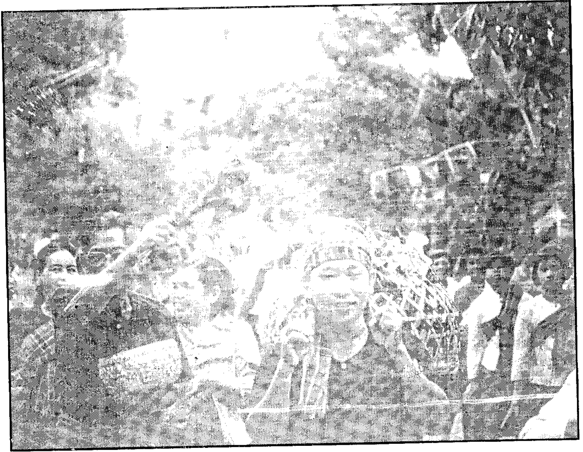
ประเพณีแห่นางแมว